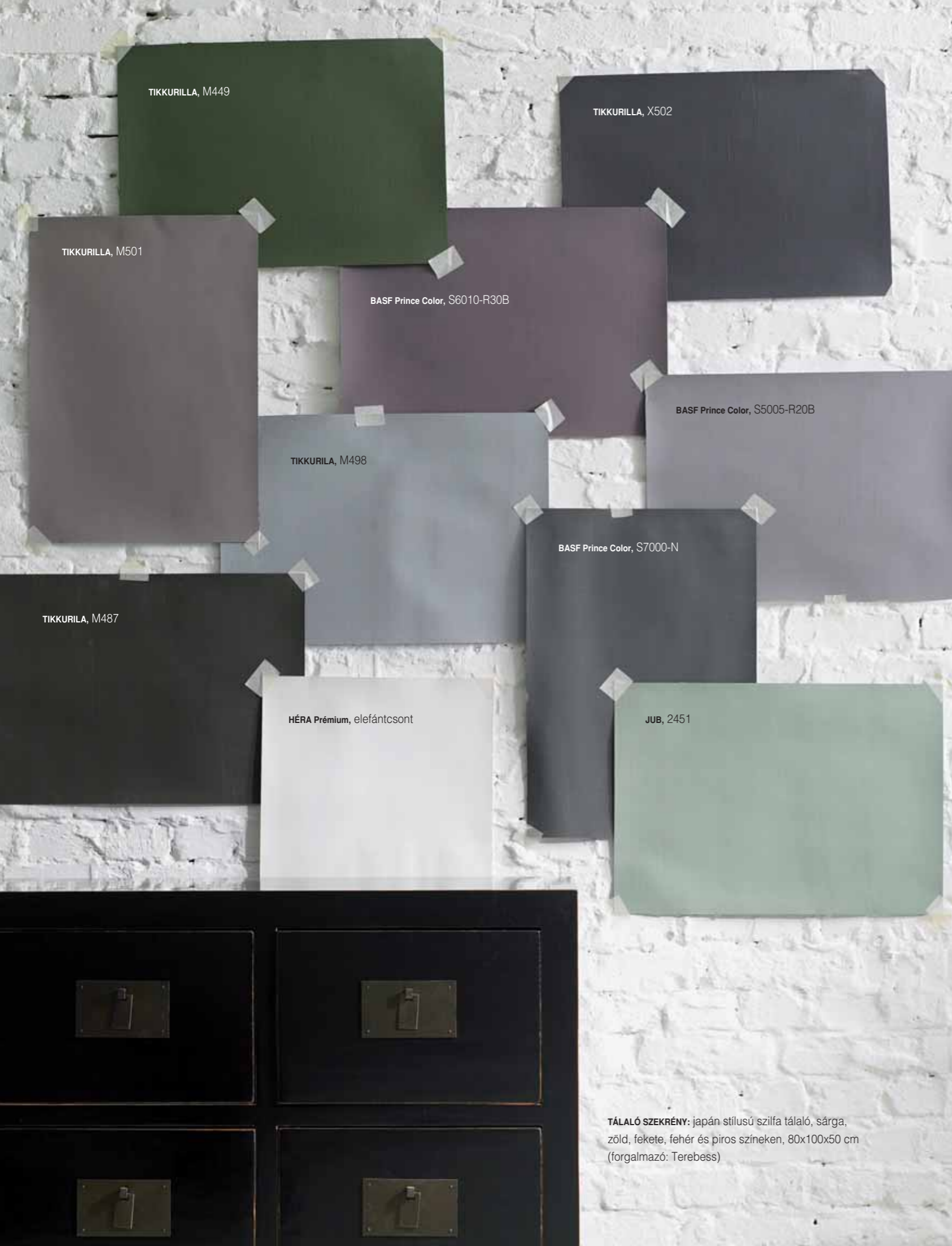
TÁLALÓ SZEKRÉNY: japán stílusú szilfa tálaló, sárga, zöld, fekete, fehér és piros színeken, 80x100x50 cm (forgalmazó: Terebess)

” NE CSAK EGY SZÍNNEL KÍSÉRLETEZZÜNK! TÖBB SZÍNBŐL IS VÁSÁROLJUNK! VANNAK OLYAN GYÁRTÓK, AKIK MINTA CÉLJÁBÓL ÁRULNAK MÁR MINI KISZERELÉSBEN IS FESTÉKEKET. NE FELEDJÜK, HOGY A FESTÉK SZÁRADÁS UTÁN MUTATJA MEG VÉGSŐ SZÍNÉT! ”